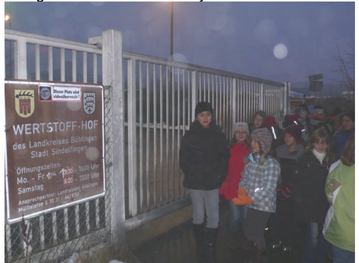
nous avons visité un « lieu de recyclage public »